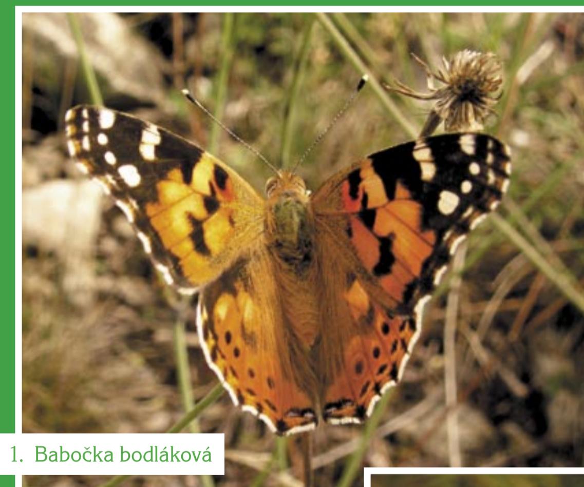
1. Babočka bodláková

Převládajícími druhy jsou kostřava žlábkovitá ( Festuca rupicola ), kostřava walliská ( F. valesiaca ) a smělek štíhlý ( Koeleria pyramidata ). Už v březnu rozkvétá ostřice nízká ( Carex humilis ), jejíž živě zelené trsy často rostou do tvaru kruhů. V dubnu otevírá své žluté květy mochna písečná ( Potentilla arenaria ). Asi nejnápadnějším jarním druhem zdejších xerothermních trávníků je však koniklec luční český ( Pulsatilla pratensis subsp. bohemica ). V květnu zde žlutě kvete trýzel škardolistý ( Erysimum crepidifolium ). Začátkem června nelze přehlédnout péřité osiny kavylu Ivanova ( Stipa pennata ). Fialovomodře kvete chrpa chlumní ( Centaurea triumfettii ). Růžovofialové květy má nízká a silně aromatická mateřídouška časná ( Thymus praecox ). Úprostřed léta zde modře rozkvétá rozrazil klasnatý ( Pseudolysimachion spicatum ).