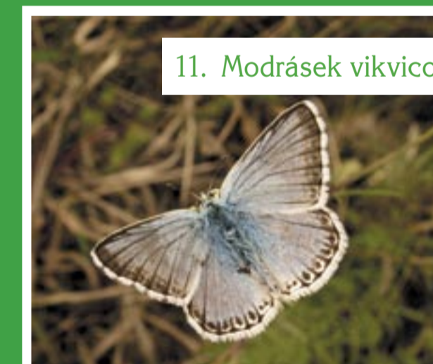
11. Modrásek vikvicový