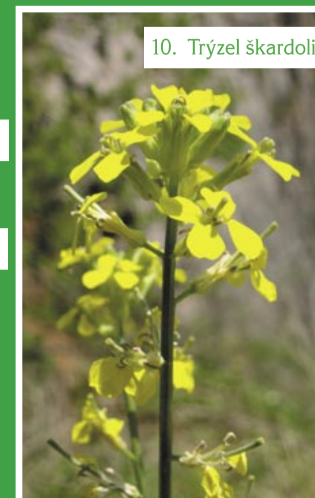
10. Trýzel škardolistý