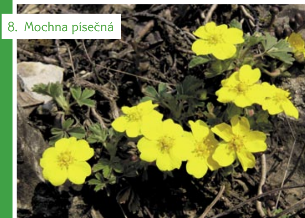
8. Mochna písečná