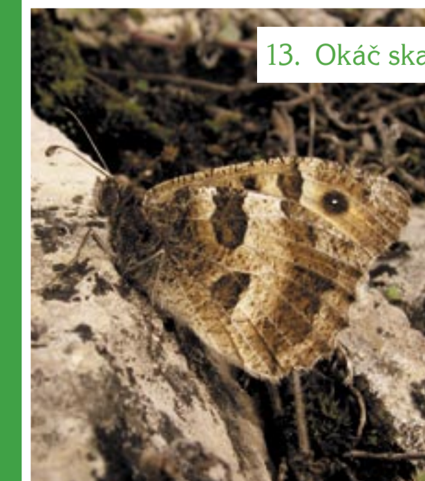
13. Okáč skalní