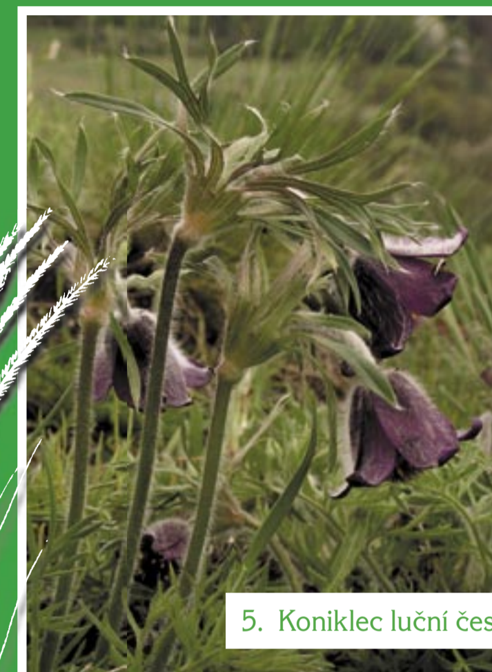
5. Koniklec luční český