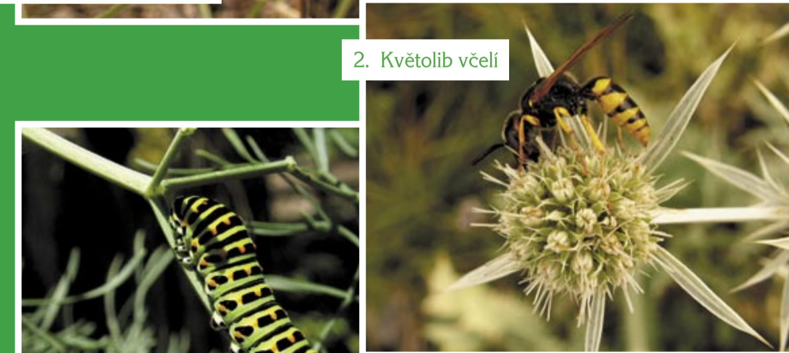
2. Květolib včeli