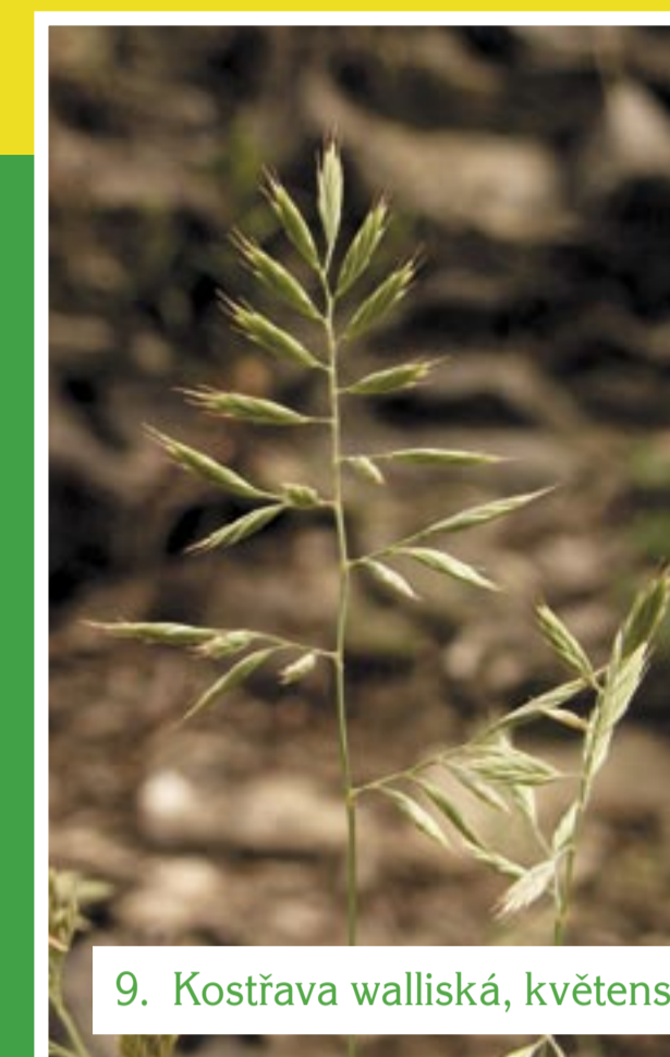
9. Kostřava walliská, květenství