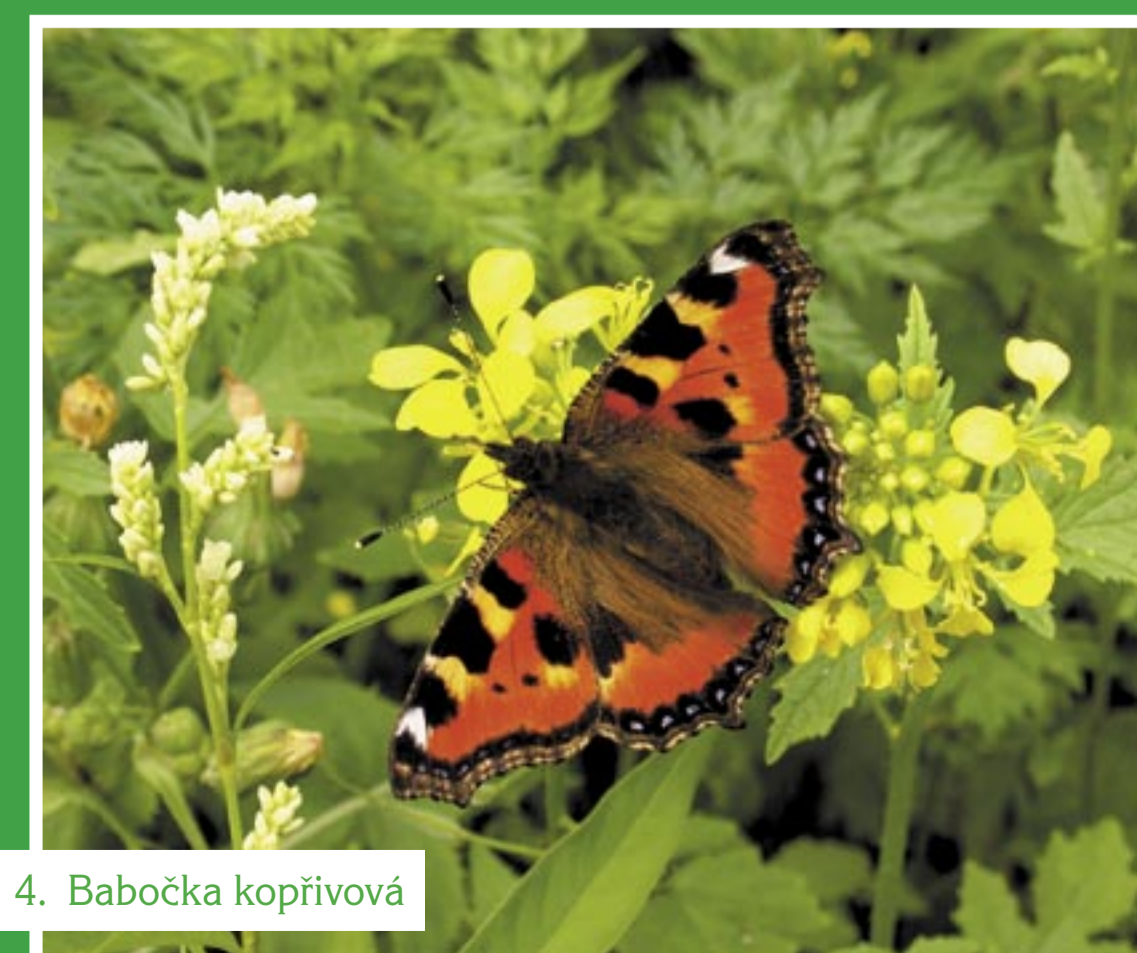
4. Babočka kopřivová