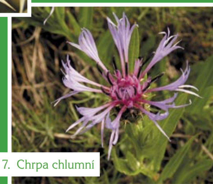
7. Chrpa chlumní