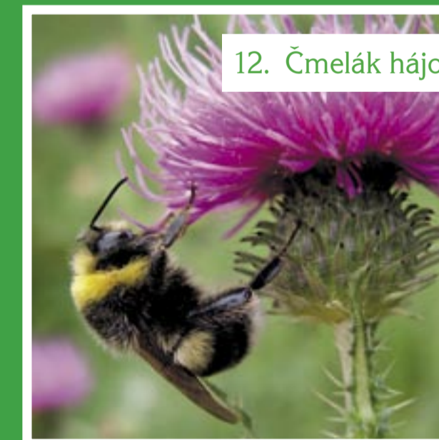
12. Čmelák hájový