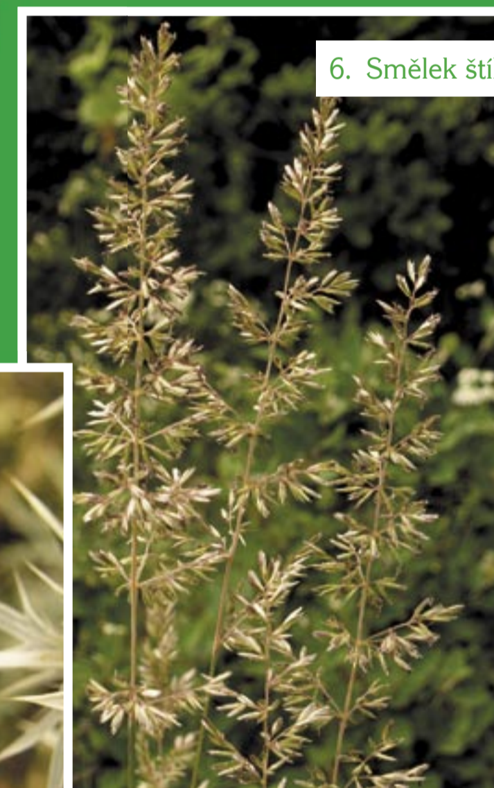
6. Smělek štíhlý